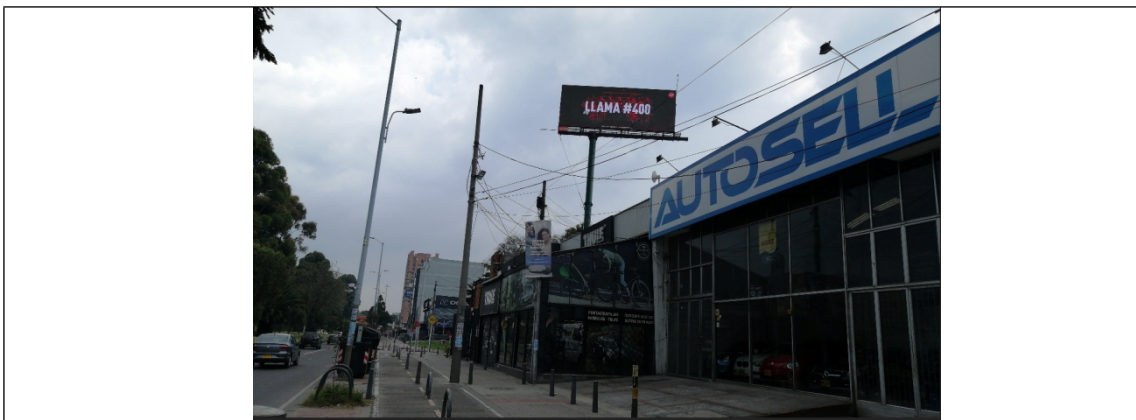
Foto No.1: Vista panorámica del predio y de la estructura de la valla ubicada en la Av. Carrera 45 No. 120 – 13 (Dirección catastral) Orientación Norte- Sur