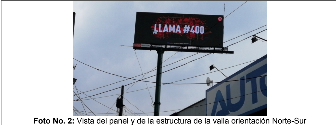
Foto No. 2: Vista del panel y de la estructura de la valla orientación Norte-Sur